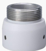
L-HA7 Adapter für Domekameras