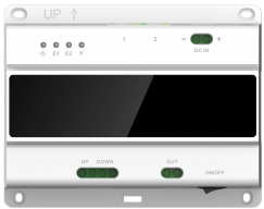
L-SW-5700 2-Draht-Switch für lunaIP Intercom