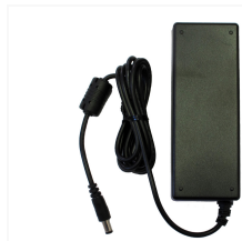
Netzteil 48 V DC, 1.25 A für L-SW-5700 Netzteil 48 V DC, 1.25 A