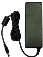
Netzteil 48 V DC, 1.25 A für L-SW-5700 Netzteil 48 V DC, 1.25 A