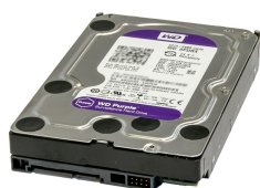
T-SPE-2000 SATA Speichere Erweiterung 2TB