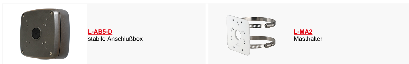
L-AB5-D stabile Anschlußbox