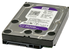
T-SPE-2000 SATA Speichererweiterung 2TB