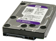
T-SPE-4000 SATA Speichererweiterung 4TB