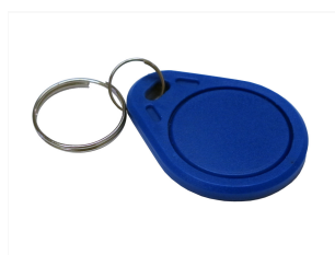
RFID-Tag RFID Transponder 13,56MHz