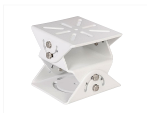
L-TH1 3-axiale Gehäusehalterung