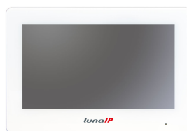
L-IS-5702 7" LCD-Bildschirm (1024 x 600 px)