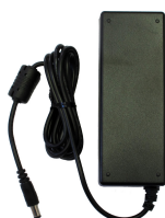
Netzteil 48 V DC, 1.25 A für L-SW-5700 Netzteil 48 V DC, 1.25 A