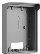
L-RA-5701-AP2 Aufputzrahmen für Single Türstation