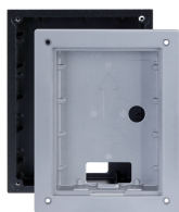
L-RA-5701-UP Unterputzrahmen für Single Türstation