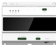
L-SW-5700 2-Draht-Switch für lunaIP Intercom