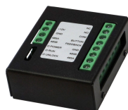
L-ER-5020 Türsprechanlagen Erweiterungsmodul