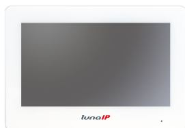
L-IS-5702-W 7" LCD-Bildschirm (1024 x 600 px)