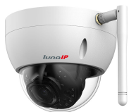
L-DC-5400-W 4 MP | 1/3" CMOS Sensor