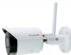
L-KC-5400-W 4 MP | 1/3" CMOS Sensor